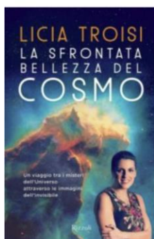
LA SFRONTATA BELLEZZA DEL COSMO Licia Troisi