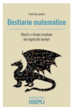
BESTIARIO MATEMATICO Paolo Alessandrini