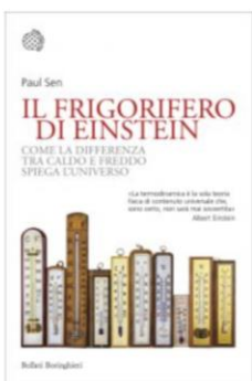
IL FRIGORIFERO DI EINSTEIN Paul Sen

Premiazione delle migliori recensioni degli Studenti partecipanti al Premio Asimov 2022 provenienti dagli Istituti Scolastici delle province di Lecce, Brindisi e Taranto